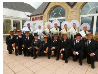
Les Bons Enfants d'Étapes, le Nord à l'honneur le 17 novembre.