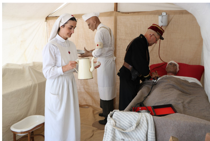
L'infirmerie du bivouac 14/18 était à découvrir rue Carnot.