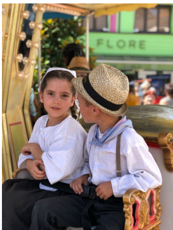
Petit moment de complicité au manège.