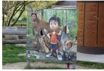
Le Grand Défi est un parc de loisirs en plein air, multi-activités basé à Saint Julien des Landes.

Les jeunes bénévoles seront remerciés le 22 octobre prochain par une sortie au parc « Le Grand Défi » à Saint Julien des Landes. Le parc nous avait accueilli l'année dernière, mais cette année de nouvelles activités sont proposées comme le laser game et le paint ball, entre autres. De quoi passer une