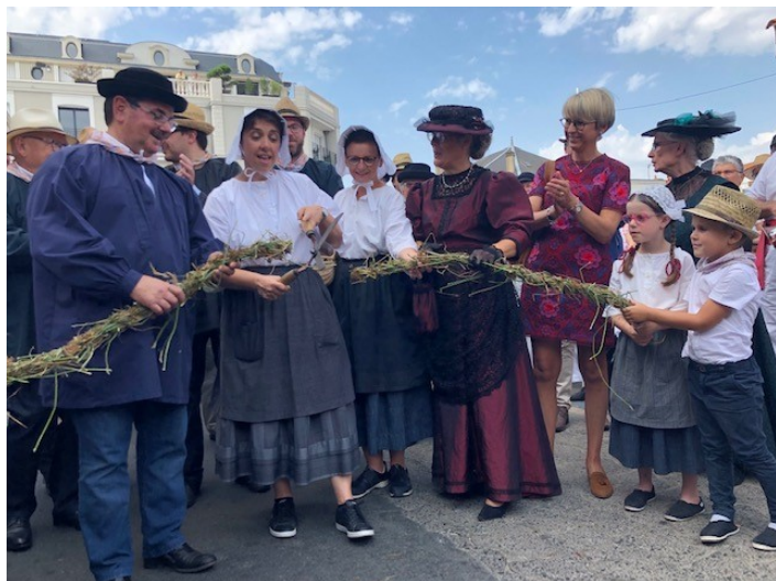
Inauguration des foires : on coupe la trolle pour l'occasion !

Poule au pot : le groupe le Marais Vendéen vous propose sa traditionnelle poule au pot le dimanche 17 novembre au Pouc'ton au Fenouiller. C'est un groupe folklorique du Nord, « Les Bons Enfants d'Étapes » qui est invité cette année. Le prix du repas, boisson comprise : 33 €. Réservations avant le 09 novembre au 02 51 35 09 17 ou au 02 51 68 12 04.